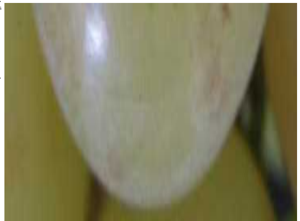
図2 果実袋の種類とかすり症の程度 (2011年、誤差範囲は標準誤差)