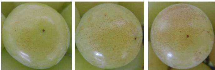
図3 収穫果粒のかすり症発生程度 (左から指数1、2、3)